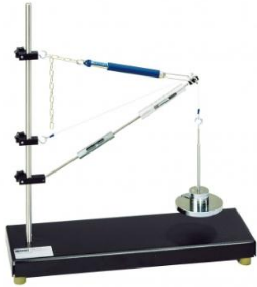
TM 115 Forze in un braccio di gru