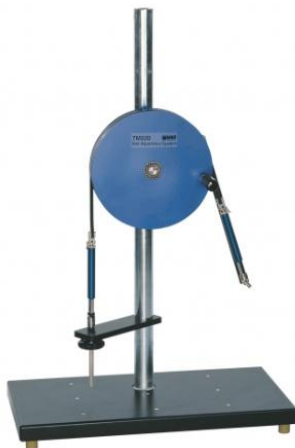
TM 220 Trasmissione a cinghia e frizione a cinghia