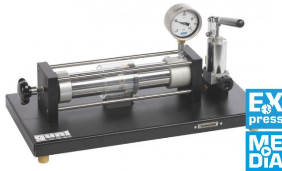
FL 130 Analisi di stress e deformazione su un cilindro a parete sottile