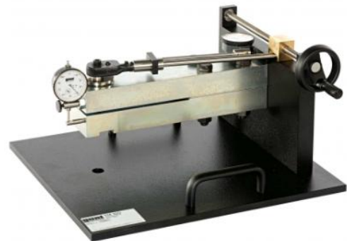
TM 320 Test dei collegamenti a vite