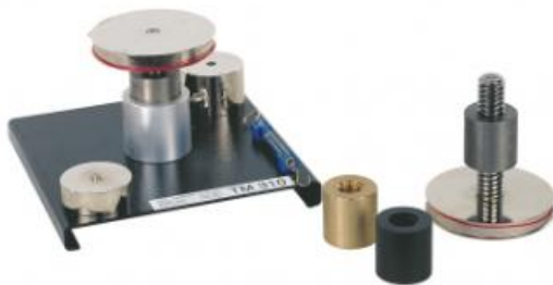
TM 310 Test delle filettature