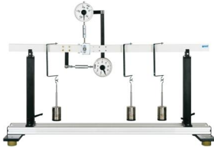
Trave su 2 appoggi: diagrammi delle forze di taglio e del momento flettente