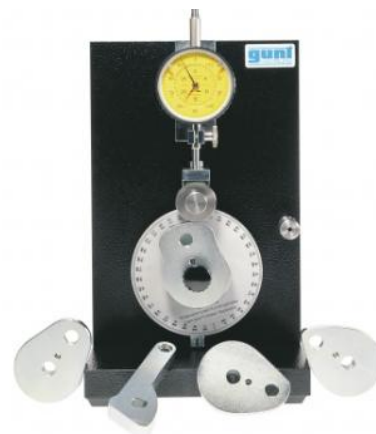
GL 110 Meccanismo a camma