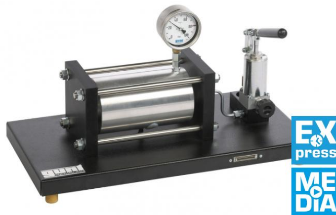
FL 140 Analisi di stress e deformazione su un cilindro a parete spessa