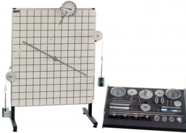
TM 110 Fondamenti di statica