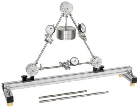
FL 111 Forze in una semplice struttura a barre